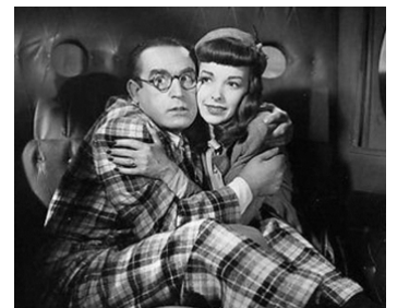
1947 OH, QUEL MERCREDI ! (Mad Wednesday) de Preston Sturges avec Frances Ramsden