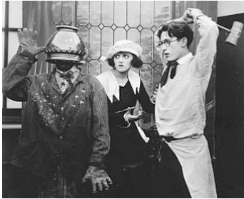
1918 PHOTOGRAPHE MALGRÉ LUI (Looks pleasant, please) d'Alfred J. Goulding avec Bebe Daniels