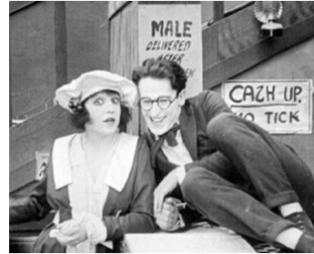
1918 MODERN PALACE (The City Slicker) de Gilbert Pratt avec Bebe Daniels