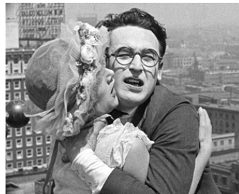
1923 MONTE LÀ-DESSUS (Safety last) de Fred C. Newmeyer & S. Taylor avec Jobyna Ralston