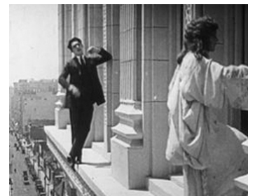
1920 MA FILLE EST SOMNAMBULE (High and dizzy) d'Hal Roach avec Mildred Davis