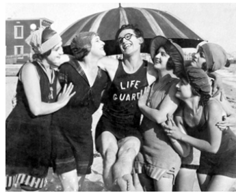
1918 HAROLD À LA RESCOUSSE (By the sad sea waves) d'Alfred J. Goulding