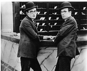
1920 LE ROYAUME DE TULIPATAN (His royal slyness) d'Hal Roach avec Gayford Lloyd