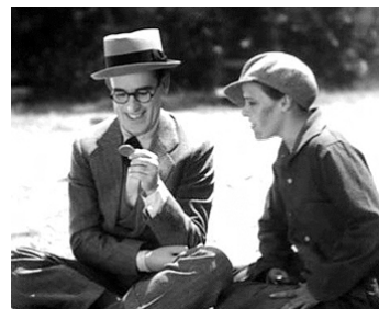
1929 QUEL PHÉNOMÈNE ! (Welcome Danger) de Clyde Bruckman ave Barbara Kent