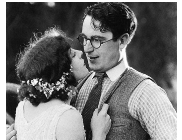
1924 ÇA TE LA COUPE (Girl Shy) de Fred C. Newmeyer & Sam Taylor avec Jobyna Ralston