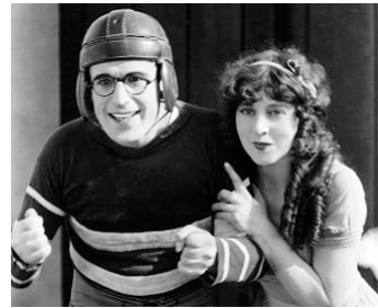
1925 VIVE LE SPORT ! (The Freshman) de Fred C. Newmeyer et Sam Taylor avec Jobyna Ralston