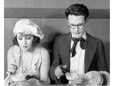
1919 COQUIN DE PRINTEMPS (Spring Fever) de Frank Terry & F. Newmeyer avec B. Daniels