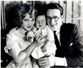
1921 UN HEUREUX MARI (I do) d'Hal Roach & Fred C. Newmeyer avec Mildred Davis