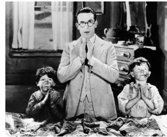
1926 POUR L'AMOUR DU CIEL (For Heaven's Sake) de Sam Taylor avec Jackie Levine