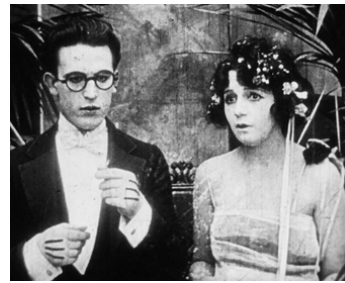
1918 UN ENFANT S.V.P. (Bashful) d'Alfred J. Goulding avec Bebe Daniels