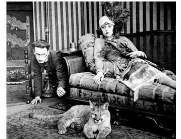
1919 LUI CHEZ LE RAJAH (The Rajah) d'Hal Roach avec Bebe Daniels