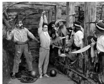
1919 HAROLD CHEZ LES PIRATES (Captain Kidd's kid) d'Hal Roach