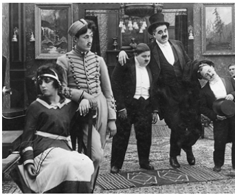
1916 LUI, CLUB BOY (Luke's speedy club life) d'Hal Roach avec Bebe Daniels