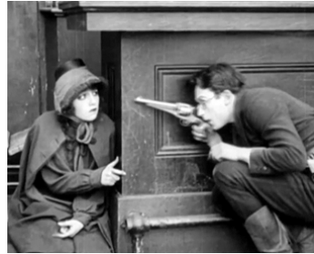
1918 FEUX CROISÉS (Two-Gun Gussie) d'Alfred J. Goulding avec Bebe Daniels