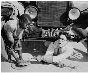
1920 OH, LA BELLE VOITURE (Get out and get under) d'Hal Roach avec Ernie Morrison