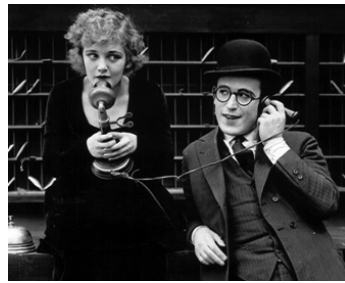
1921 QUEL NUMÉRO DEMANDEZ-VOUS ? (Number, please) de F. Newmeyer avec M. Davis