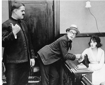
1919 ON N'ENTRE PAS (Ask Father) d'Hal Roach avec Sammy Brooks, Bebe Daniels