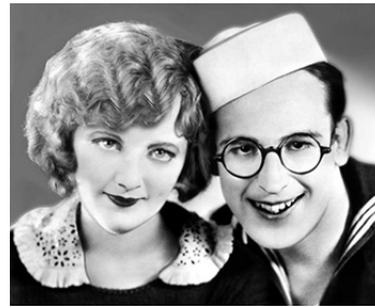
1921 MARIN MALGRÉ LUI (A Sailor-made man) de F. Newmeyer & S. Taylor avec M. Davis