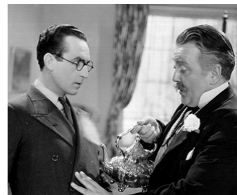
1938 PROFESSEUR SCHNOCK (Professor Beware) d'Elliott Nugent avec Raymond Walburn