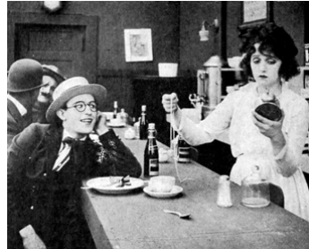
1919 HAROLD A DES VISIONS (Before Breakfast) d'Hal Roach avec Bebe Daniels