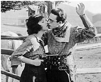
1919 COCO DE CHICAGO (Billy Blazes, Esq.) d'Hal Roach avec Bebe Daniels