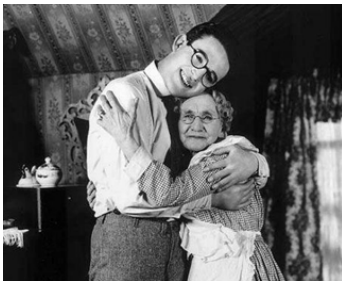
1922 LE TALISMAN DE GRAND-MÈRE (Grandma's boy) de F. Newmeyer avec Anna Tomnsend