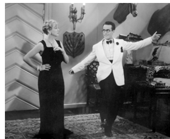
1935 SOUPE AU LAIT (The milky Way) de Leo McCarey avec Verree Teasdale