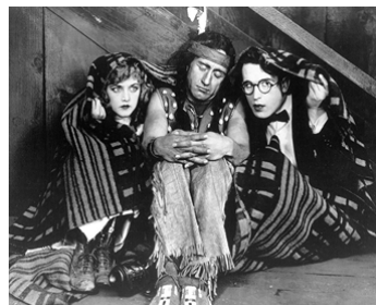
1920 POUR LE CŒUR DE JENNY (An eastern westerner) d'Hal Roach avec Mildred Davis