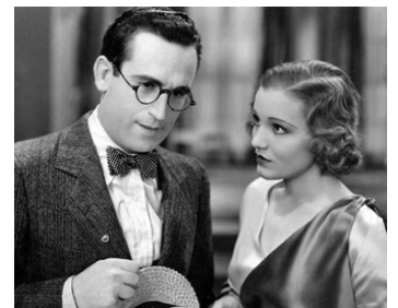
1932 SILENCE ON TOURNE (Movie Crazy) de C. Bruckman avec Constance Cummings