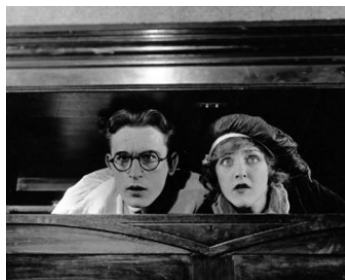
1920 LE MANOIR HANTÉ (Haunted Spooks) d'Alfred J. Goulding avec Mildred Davis