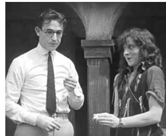
1923 POURQUOI S'EN FAIRE ? (Why worry ?) de Newmeyer & Taylor avec Jobyna Ralston