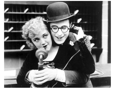
1922 LE DOCTEUR JACK (Dr. Jack) de Fred C. Newmeyer avec Mildred Davis