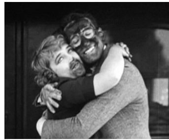
1921 POUR L'AMOUR DE MARY (Now or ever) d'Hal Roach avec Mildred Davis