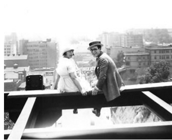
1921 LE VOYAGE AU PARADIS (Never weaken) de Fred C. Newmeyer avec Mildred Davis