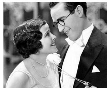
1930 À LA HAUTEUR (Feet first) de Clyde Bruckman avec Barbara Kent