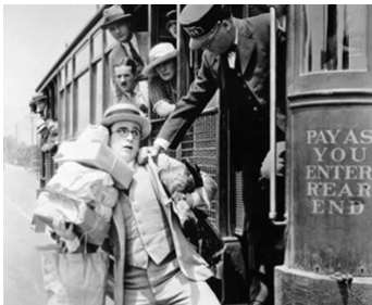
1924 OH ! CES BELLES-MÈRES (Hot Water) de Fred C. Newmeyer & Sam Taylor