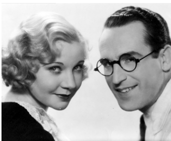
1934 PATTE DE CHAT (The Cat's Paw) de Sam Taylor avec Una Merkel